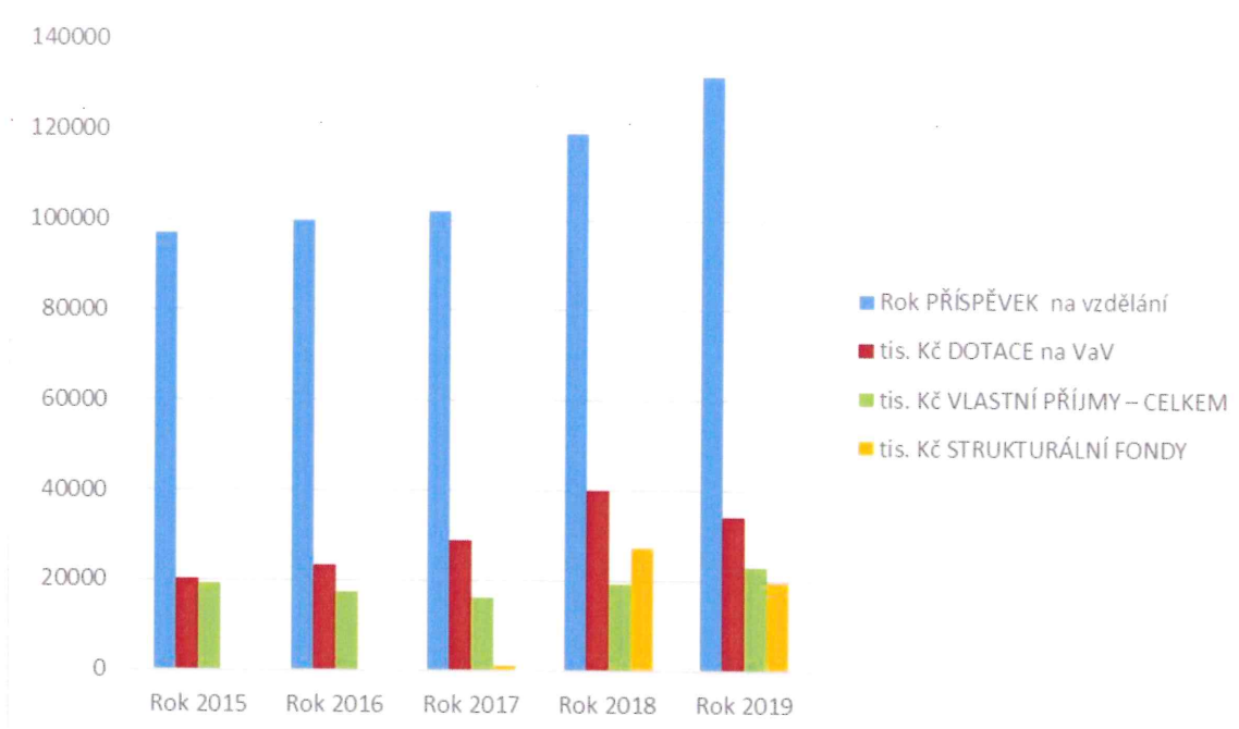
Graf č. I. 1.: Příjmy FIT v letech 2015 – 2019

Z grafu je patrné, že celkový objem finančních zdrojů zaznamenává nárůst. Největší část finančních zdrojů činí příspěvek na vzdělávací činnost cca 63 %. V roce 2019 se zvýšil příspěvek na vzdělání a DČ. V roce 2019 se zvýšil příspěvek na vzdělání a DČ. Dotace na VaV se skládá z dotace MŠMT 15 859 tis. Kč a dotace externích grantových agentur 18 354 tis. Kč.